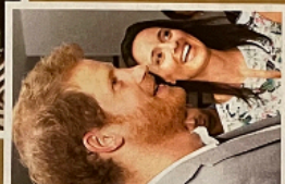
VIP-GÄSTE wie Prinz Harry gehörten lange in ihrem Alltag